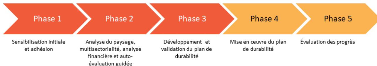
Figure 1 Approche de la durabilité soutenue par l'USAID en Afrique de l'Ouest

négligées, qui vise à garantir "des approches holistiques et transversales, y compris l'intégration entre les programmes MTN, l'intégration dans les systèmes de santé nationaux, la coordination avec les secteurs adjacents et le renforcement des capacités des pays et du soutien mondial." 1