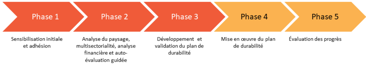
Figure 1 Approche de la durabilité soutenue par l'USAID en Afrique de l'Ouest